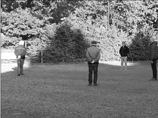
■ Houd afstand!