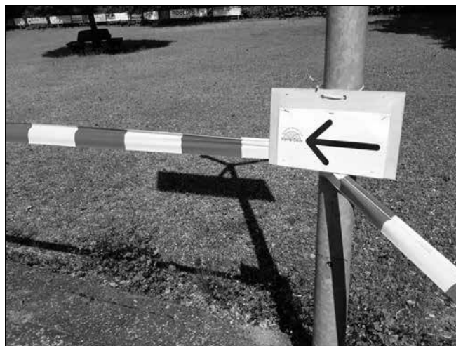
■ Volg de aanwijzingen.