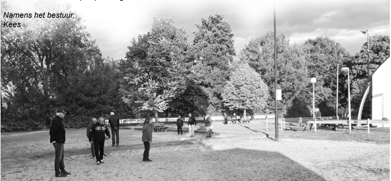
■ Gezellig toch?