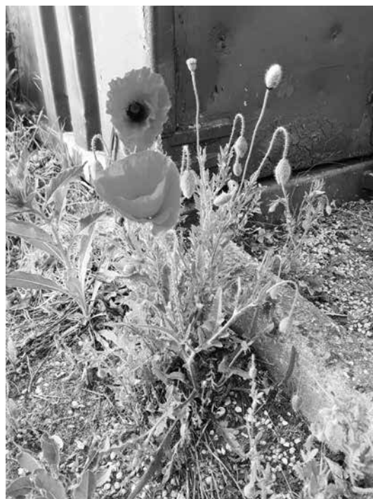
■ Het onkruid groeit mooi.