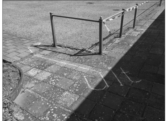
■ De uitgang.