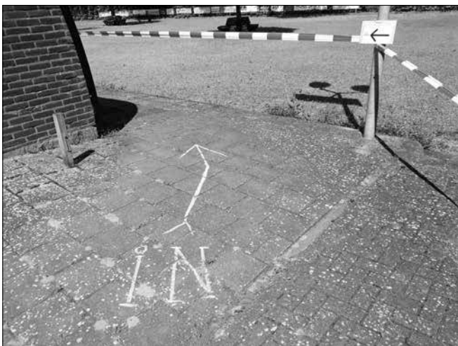
■ De entree.